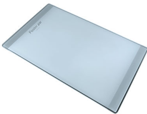
Planche de découpe en verre 8631 300