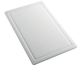
Planche de découpe en HPDE 8657 001